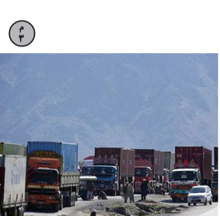
د یو شمېر وارداتي اقلامو د تعرفې په اړه پرېکړي وسوي