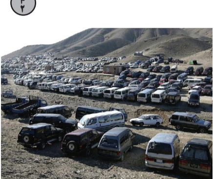
د رڼد ثبت و محصول موټر های بدون اسناد در کشور آغاز شد