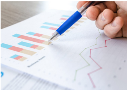
د کمرکي عوایدو د لومړیو شپږو میاشتو ارزونه سوه