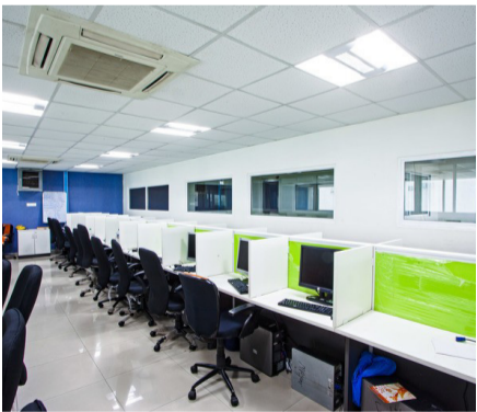
په یوه اداره کې د مسلکي شخص ګمارنه