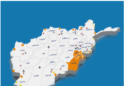
د کورنی پلټني لوی رئیس لوگر، پکتیا، پکتیکا او خوست ولایتونو ته سفر وکړ