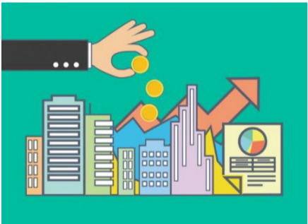
Returned properties of the Stat-Owned Corporations