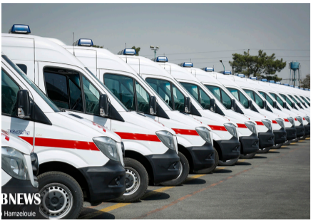
تحويلی ۱۲۵ امبولانس به وزارت صحت عامه