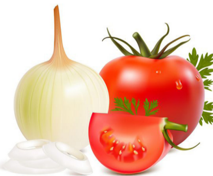
د پیازو او تازه رومیانو گمرکي وارداتي تعرفه