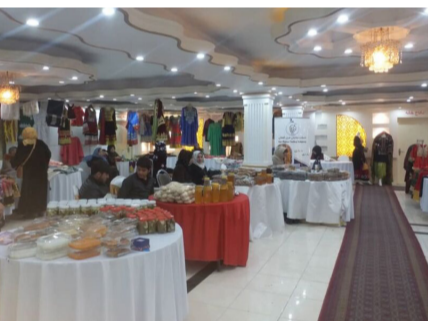
د خپل هیواد خپل تولید ملي نندارتون پای ته ورسېده