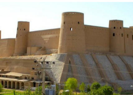
رئیس عمومی تفتیش داخلی به ولایت هرات