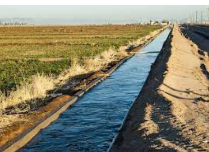
Minister of Finance visits Qush Tepa Irrigation Canal