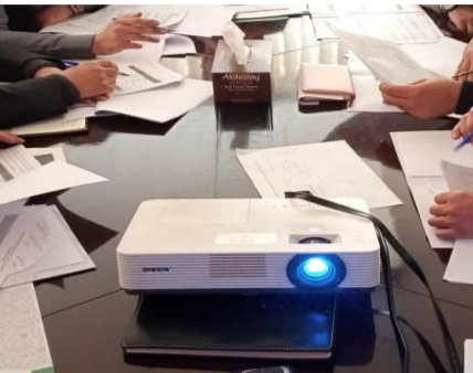
د یو شمېر دولتي شرکتونو عمومي ارزونه تر