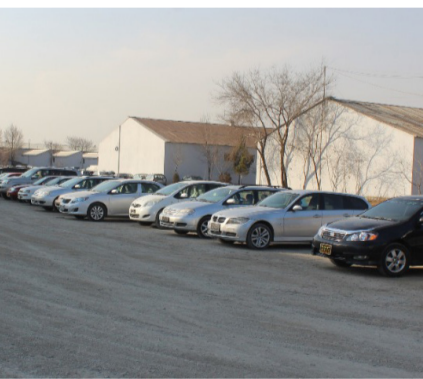
Registration Process of Undocumented Vehicles Accelerates