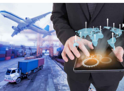
The Ministry of Finance Waived Tax Penalties of the Craftsmen and