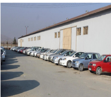
روند ثبت و محصول موثر های بدون اسناد در تمامی گمرکات افغانستان به سرعت جریان دارد