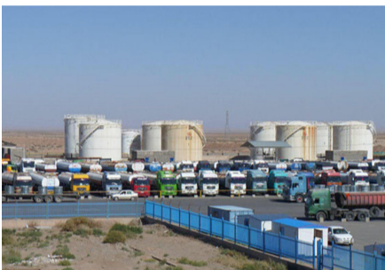
د روان کال په درېیمه ربعه کي په گمرکونو کي د تر سره سوو فعالیتونو تخنیکي ارزونه وسوه