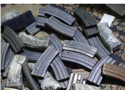
جولوگیری از قاچاق تجهیزات نظامی در گمرک