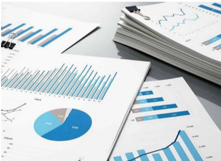
نگاه اجمالی بر سیر تحولات در شرکت های دولتی