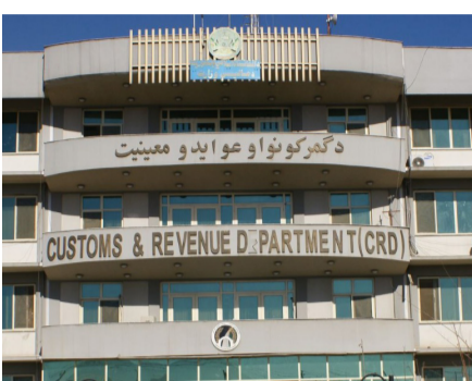
رئیس عمومی عواید و معاون عملیاتی این