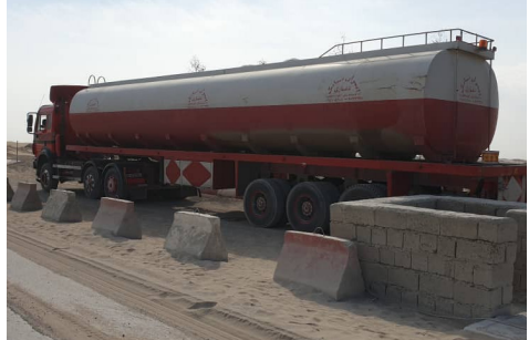
د نیمروز په گمرک کې د نیلو له یو ټانکر سره جعلي گمرکي سندونه ونيول سول