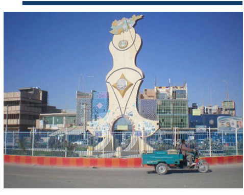
د کورنۍ پلټنې لوی ریاست پلاوي نیمروز ولایت ته سفر وکړ