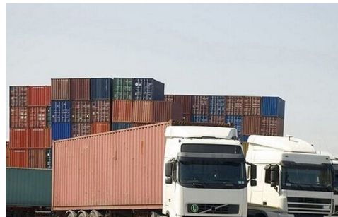
د تعرفی او قیمت گذاری پخوانیو ناسمو کوډونو د اصلاح په موخه تخنیکي کمیته جوړه سوه

د افغانستان اسلامي امارت د کابینې په ۲۵ مه غونډه کې چې د ښاغلي رئیس الوزرا الحاج ملا محمد حسن اخوند په مشرۍ ترسره سوه، د ۱۴۰۲ مالي کال د بودیجې سند تائید او مالیې وزارت ته یې په اړه د