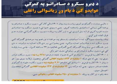
د ډبرو سکرو د صادراتو په گمرکي عوایدو کې د پام وړ زیاتوالی راغلی