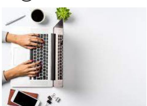
برنامه آموزشی آنلاین برای مدیران خدمات مستوفیت های ولایات دایر گردید