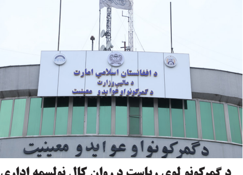
د گمرکونو او عوایدو معینیت د گمرکونو لوی ریاست د روان کال نولسمه اداري ناسته وسوه