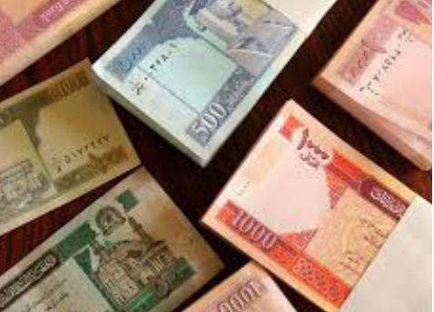
د بهرنیو اسعارو پر وړاندې د افغانیو ارزښت کمېدل

• په کلني ډول دي د ملي محصولاتو نندارتونونه په ترمز نړیوال سوداگریز مرکز کي تنظیم سي • په (۲۰۲۴) ز کي د ازبکستان او افغانستان ترمنځ سوداگریزه تبادله (۱،۱۳) میلیارده ډالرو ته رسېدلې ده • نهمه ده د افغان - ازبک ترمنځ سوداگریز حجم (۳) بیلینو ډالرو ته لوړ سي.