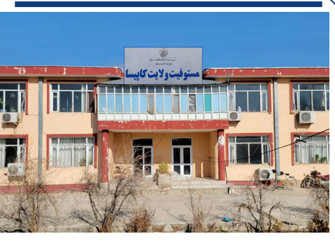
د گمرکونو او عوایدو معین د کاپیسا او پروان ولایتونو د مستوفیتونو چاري و ارزولي