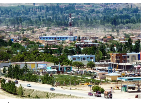
د گمرکونو او عوایدو معین د میدان وردگو مستوفیت له چارو څخه لیدنه وکړه